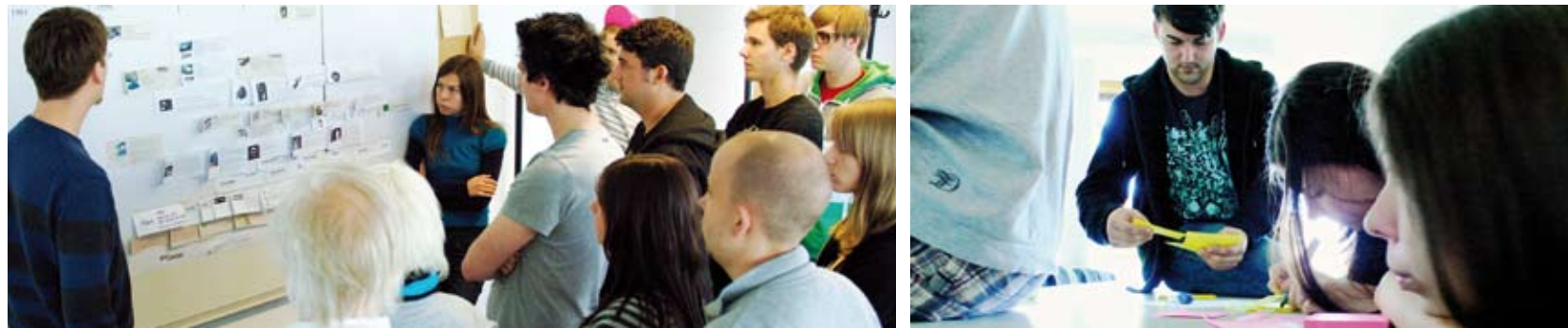
Workshop | Innovation by Design | Hochschule Hof | 5 ECPS

Innovationen beginnen im Kopf. Sie erfordern Phantasie, Inspiration und die Fähigkeit zum divergierenden Denken. Ideen und Entwicklungen müssen erst in marktfähige Produkte umgesetzt werden. Ein systematischer Innovationsprozeß erhöht dabei die Durchsetzungskraft des Produktes bei der Markteinführung.